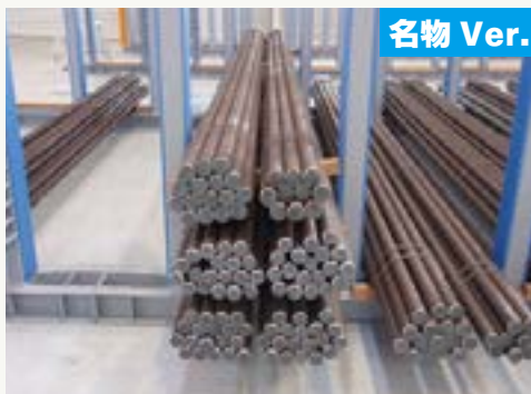
2束保管(名古屋物流センター内)