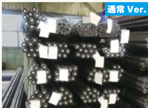
4束保管(東海物流センター内)