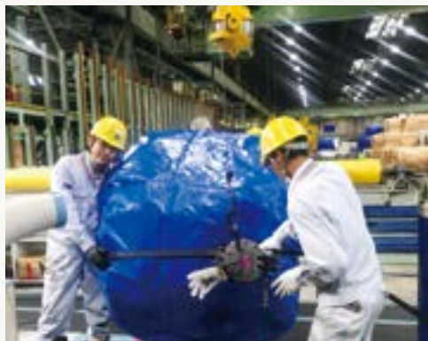
梱包しているところ